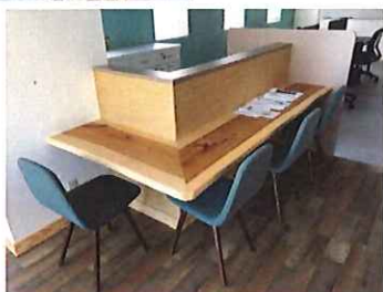
【1階キッチンカウンター】 (第2の応接スペース)